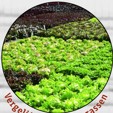
Vergelijking van slarassen