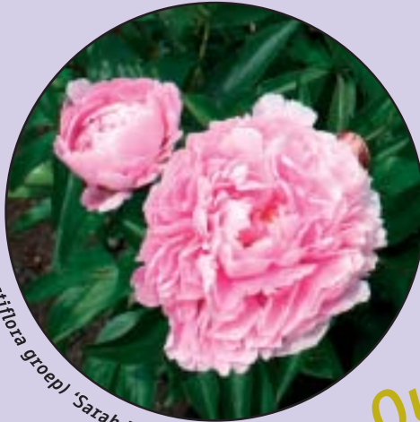
Paeonia (lactiflora groep) 'Sarah Bernhardt'