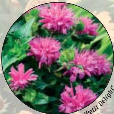
Monarda 'Petit Delight'

Vanuit de wetgeving moeten vaste planten rasecht verhandeld worden. Daarnaast wil de koper van vaste planten ook de zekerheid hebben dat hij krijgt waarom hij gevraagd heeft. Naktuinbouw, kwekers en handelaren van vaste planten hechten daarom grote waarde aan goed geïdentificeerd plantmateriaal. In Nederland is formeel geen enkele organisatie verantwoordelijk voor deze identificatie. Dit moeten de kwekers zelf doen.