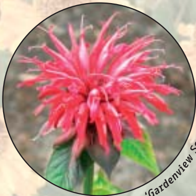
Monarda 'Gardenview Scarlet'

In Roelofarendsveen ligt op het terrein van Naktuinbouw de 'Moederplantentuin' voor vaste planten. Deze sortimentstuin, bestaande uit rasechte vaste planten, dient als referentiekader voor het vaste plantenvak in Nederland. De meest verhandelde vaste planten, circa 3.000 vrij verkrijgbare rassen en 800 kwekersrechtelijk beschermde rassen, staan hier op één plek bij elkaar.