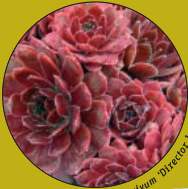
Sempervivum 'Director Jacobs'

In Roelofarendsveen ligt op het terrein van Naktuinbouw de 'Moederplantentuin' voor vaste planten. Deze sortimentstuin, bestaande uit rasechte vaste planten, dient als referentiekader voor het vaste plantenvak in Nederland. De meest verhandelde vaste planten, circa 3.000 vrij verkrijgbare rassen en 800 kwekersrechtelijk beschermde rassen, staan hier op één plek bij elkaar.